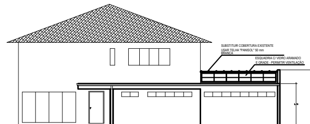
ELEVACAO SUL - RUA 1/75